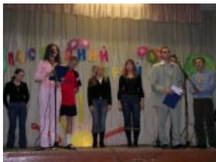
Паспарту, Пятница, Флинт, Бармалей, Джек Воробей.

Справившись со следующим испытанием, участники получили вкусные призы. Чтобы не остаться голодными, они должны были показать свою меткость. Герои метали дротики в круг, и полученный ими вкусный приз зависел от количества набранных очков.