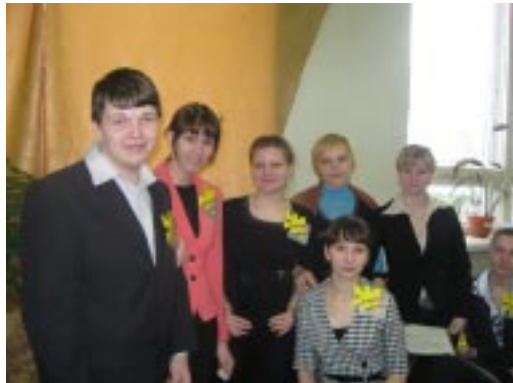
••••• Добрый и чуткий человек

26 марта в педагогическом колледже в программе недели школьного отделения были проведены конкурсы педагогического мастерства «Моя профессия — учитель», который стал доброй традицией.