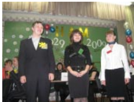
••••• Молодая, активная, творческая